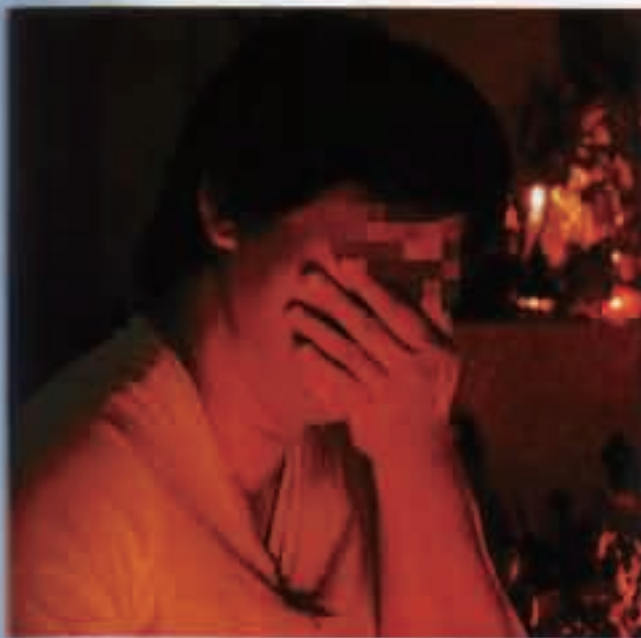
阿群二连三流产看到东西，说着痛苦的往事不禁哭了起来，幸好有体贴的丈夫安慰她。