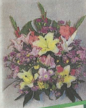
拜神一定要用鲜花，可别用假花供神。

床底不要收藏杂物，那是安眠的地方，要设安心入眠的地方，放杂物会令你心神恍惚，无法专心做生意。