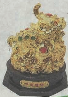
土地公右边可摆置招财貔貅，主求财。

土地公的职责是帮我们看守家门，帮我们减少病灾的入侵，还有就是帮我们防盗贼入屋，甚至有时土地公也会报梦让我们预防意外的发生，好让我们逢凶化吉。