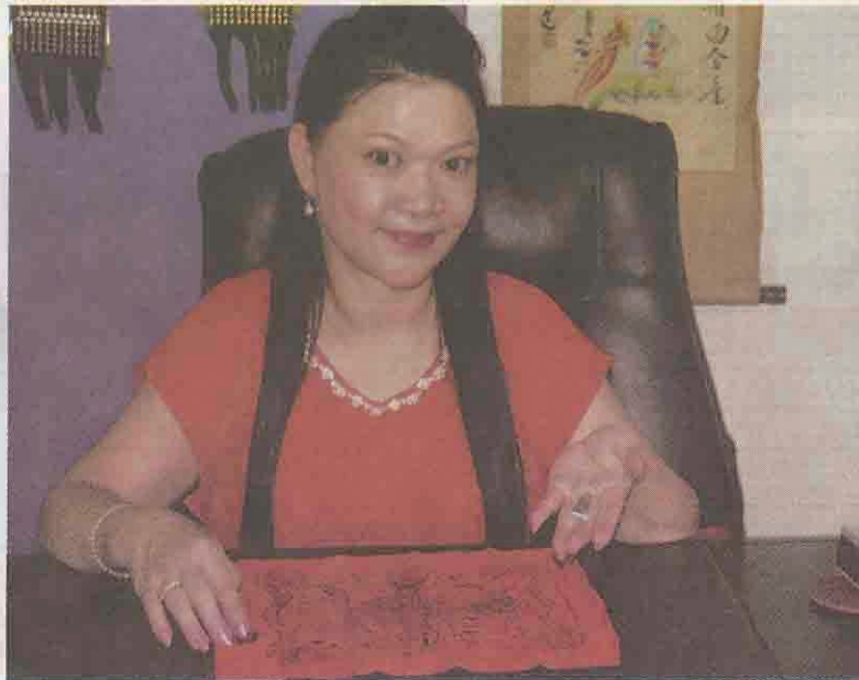
●妙嬋師太的雲南苗疆性愛雙修法，助挽救時下夫妻性愛不和諧的問題。